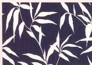
715255 , kolekce Out of Africa, vinyl, Tapety Zlín, 779 Kč