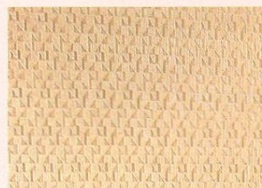
Go/Pro2 , 517616, přetíratelná tapeta, www.e-color.cz, 435 Kč/role