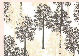
Decor Maison , kolekce Saga, MAT Flowers, 1468 Kč/role