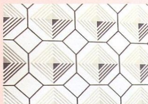
Kolekce Darty , Designers Guild, 3D H., 2135 Kč/role